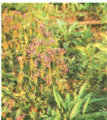
846. Суховершки звичайні.